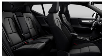
クライメート・パッケージ ● ステアリングホイール・ヒーター ● フロント・シートヒーター ● リア・シートヒーター