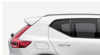
ダークティンテッド・ガラス (リア・ウインドー5面)