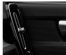
ハイパフォーマンス・オーディオシステム (250W、8スピーカー)