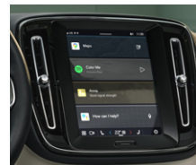
タッチスクリーン式 センターディスプレイ (9インチ)