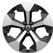
5-Yスポーク 7.5J×19インチ ダイヤモンドカット/マットグラファイト

Ultimate B4 AWD Dark Edition / Ultimate B4 AWD