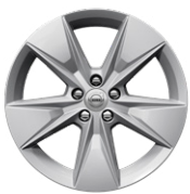
5スポーク 7.5J×18インチ シルバー