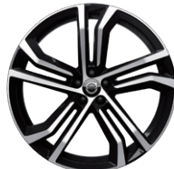
5ダブルスポーク 8.5J×20インチ ダイヤモンドカット/ブラック