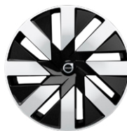
8スポーク 8.5J×19インチ ダイヤモンドカット/ブラック

Ultimate T8 AWD plug-in hybrid (オプション設定)