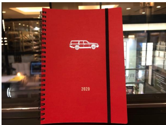
箔押しオリジナルノート