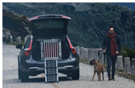
ドッグボックス & イージーステップ

ボルボ・カー・ジャパン公式WEB サイト VOLVO with PET「ボルボとペットがいる暮らし」